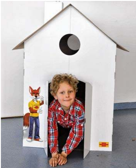
Auch die Kleinen haben Spaß auf der Baumesse.