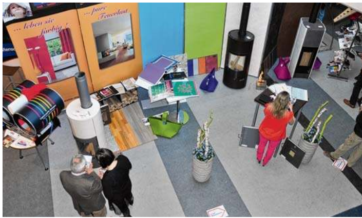
Die Besucher der Baumesse am 22. und 23. März können sich auf individuell gestaltete Stände der jeweiligen Handwerker freuen.