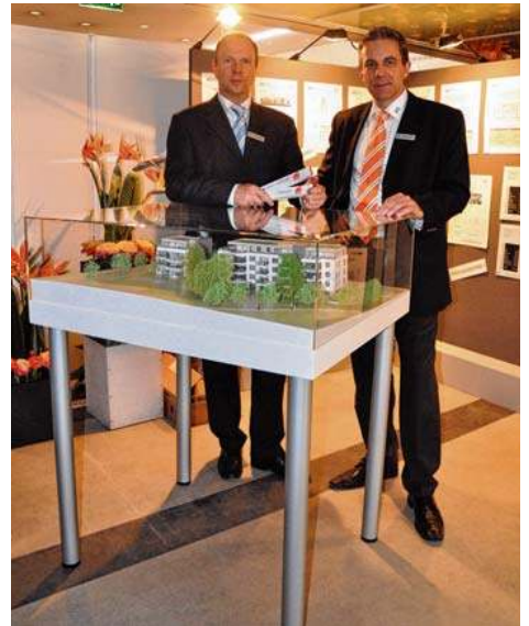
Persönliche Gespräche und individuelle Beratung gibt es im Überlinger Kursaal an vielen Ständen.

Mit dabei ist in diesem Jahr auch die Polizei, die die Besu-